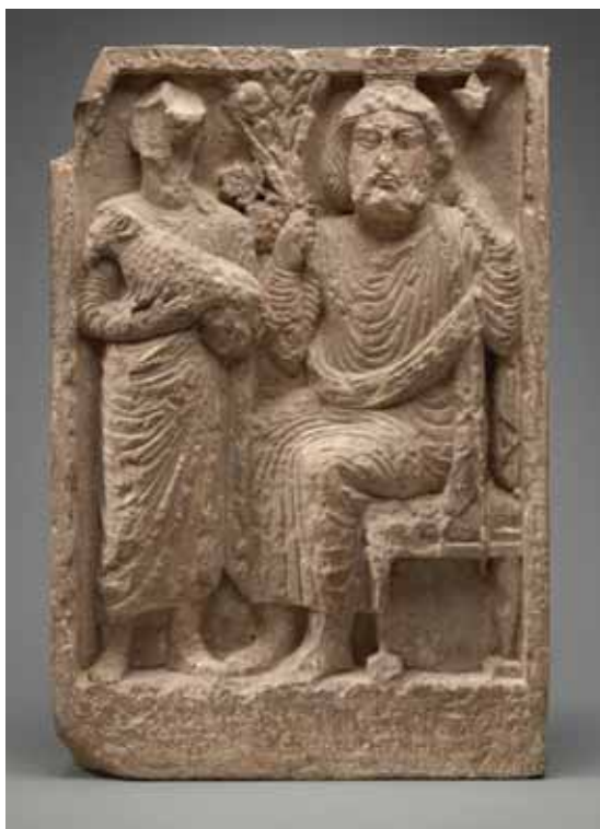
Мал. 3. Рэльеф з выявай Баал-Шаміна з надпісамі на арамейскай і грэцкай мове (па: [Teixidor 1979, 145])