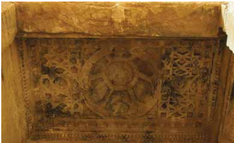
Мал. 1. Рэльеф з адытона храма Бела ў Пальміры. (па: https://bit.ly/3s9O5Vm )

У гэтай трыядзе вышэйшым і галоўным богам лічыўся Бол-Бел, вобраз якога меў сінкрэтычны характар. Мяркуецца, што мясцовы пальмірскі бог Бол мог зліцца з вобразам месопатамскага бога Бела-Мардука, а потым атрымаць найменне Бел, такая думка на сённяшні дзень дамінуе сярод даследчыкаў пальмірскай рэлігіі [Шифман 1980, 29; Gawlikowski 2015]. Хаця эпиграфічныя звесткі паказваюць, што на ранніх этапах міжкультурнага ўзаемадзеяння два варыянты імя вярхоўнага бога суіснавалі [Teixidor 1979, 1]. Канчаткова імя Бел замацавалася, на думку І. Шыфмана, толькі ў сярэдзіне I тыс. да н. э. [Шифман 1980, 29]. М. Растоўцаў падкрэсліваў, што вобраз і культ вавілонскага бога Бела-Мардука, які пранікаў на землі антычнай Сірыі ў часы элінізму, ужо меў сінкрэтычны характар, бо даследчык заўважае істотны ўплыў культуры і вераванняў парфянскай дзяржавы [Ростовцев 2010, 123–125]. Такая думка можа аказацца слушнаю, бо ў перыяд I–III ст. Пальміра выступала гандлёвым пасрэднікам паміж грэка-рымскім светам і Парфіяй, што ўмацоўвала сувязі паміж пальмірскай і парфянскай культурамі [Edwell 2008, 31–63].