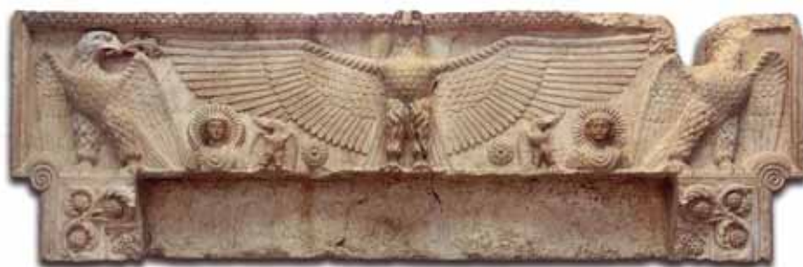
Мал. 5. Рэльеф з храма Баал-Шамина ў Пальміры

Сінкрэтычны характар мае вобраз пальмірскага бога Малакбела, бо культ і іканаграфія гэтага бога магчыма знаходзіліся пад уплывам іншых рэлігійных і культурных традыцый. Магчыма Малакбел выступаў як пасланец бога Бела, што адразу дае новы доказ таго, што гэты бог мог быць спачатку як іпастась пальмірскага бога Яргібола [Шифман 1980, 32–33].