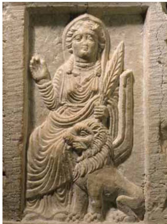
Мал. 8. Рэльеф з выявай багіні Алат са львом з храма Баал-Шаміна

У релігійнім жыцці антычнай Пальміры істотную ролю ігралі культуры іншых багоў, якія таксама мелі рознае этнакультурнае паходжанне. У антычнай Пальміры шанавалі багоў Эльконера, які асацыяваўся з Пасейдонам, Шадрафа, які набліжаўся да вобразаў Апалона, Баал-Хамон, Набу, Нергал, Тамуз, Арду, Абгала і іншых [Teixidor 1979, 25–29, 101–111].