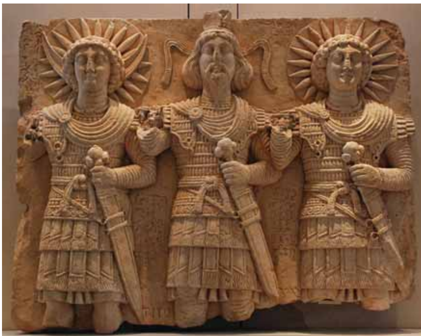
Мал. 4. Рэльеф з выявай пальмірскай трыяды Аглібола, Баал-Шаміна і Малакбела

Х. Тэйшыдар прыводзіць выяву аднаго з пальмірскіх рэльефаў з Дура-Еўропас (I ст. н. э) (мал. 3), на якім заўважна выява Баал-Шаміна. Сам рэльеф суправаджаецца пасвячальнымі надпісамі на грэцкай і арамейскай мовах. Тэксты надпісаў даказваюць сувязь вобразаў пальмірскага Баал-Шаміна і грэка-рымскага Зеўса-Юпітэра [Teixidor 1979, 130]. Але гэтая выява прымушае заўважыць тое, што Баал-Шамін антычнай Пальміры без ваенных даспехаў, як на іншым вядомым рэльефе (мал. 4). Можна выказаць думку, што на рэльефе з Дура-Еўропас вобраз Баал-Шаміна вельмі блізка да вобразу бога Бела. Гэта дазваляе лічыць больш верагоднай пазіцыю І. Шыфмана, які падкрэсліваў сувязь паміж Баал-Шамінам і Белам [Шифман 1980, 32].