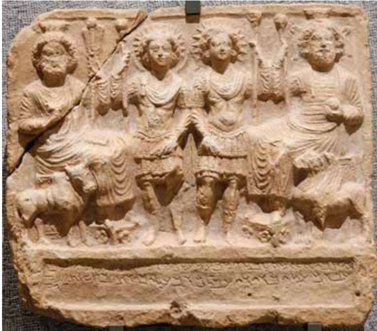
Мал. 2. Рэльеф з выявай Бела, Баалшаміна, Яргібола і Аглібола

Разам з гэтым, культ Яргібола звязаны з крыніцай Эфкай і часта выступае як апякун і ўвасабленне гэтай крыніцы. Але ў рэлігійным мастацтве антычнай Пальміры Яргібол часцей выступае як бог, які таксама апрануты ў даспехі з сонечным німба на галаве. Хаця варта падкрэсліць, што часам ў іканаграфіі Яргібола сустракаюцца два касмічныя свяцілы, што ўскладняе высвятленне сутнасці вобразу гэтага бога. Х. Тэйшыдар тлумачыць факт спалучэнне двух свяціл у іканаграфіі Яргібола ўплывам парфянскай культуры і ўздзеяннем мясцовага мітраізму, прысутнасць якога заўважаецца ў гэтым рэгіёне, бо ў Дура-Еўропас знаходзіўся мітрэўм [Teixidor 1979, 29–34]. Разам з гэтым, даследчык звяртае ўвагу на грэцкія надпісы пад выявамі Яргібола, дзе той атаесамляецца з Гелісам або Апалонам, бо ў I ст. да н. э. вобразы гэтых багоў набліжаліся да вобразу Мітры [Teixidor 1977, 110–113]. Такім чынам можна выказаць думку, што іканаграфія і эпіграфічны матэрыял даказваюць, што мясцовы пальмірскі бог пад уплывам іншых культурных і рэлігійных традыцый набываў усё больш рысы сінкрэтычнага бога, у кульце яго магчыма прысутнічалі складаныя тэалагічныя ўяўленні. Але такую думку можна выказаць ўпэўнена толькі тады, калі канчаткова будзе даказана, што вобраз пальмірскага Яргібола набліжаўся да вобразу іранскага Мітры.